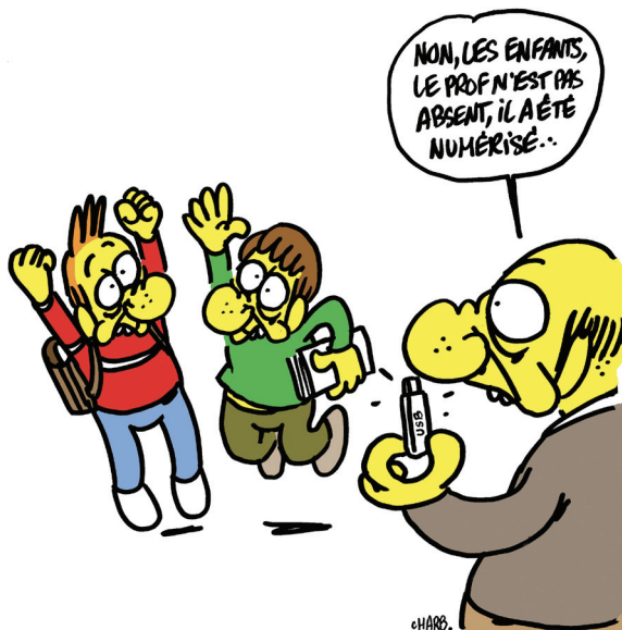
Dessin de Charb